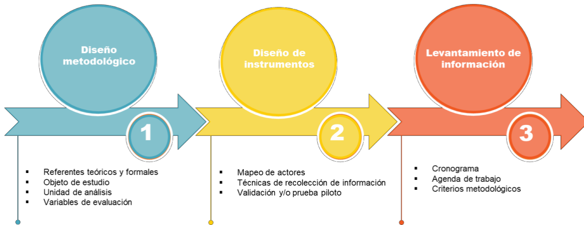
Figura 1. Criterios técnicos para la realización del trabajo de campo