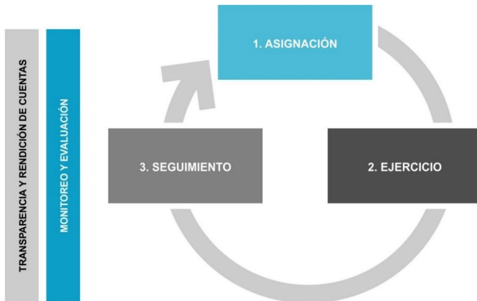
“Modelo General de Procesos”